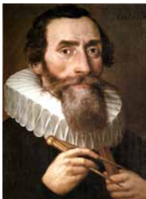
Johannes Kepler malt af ukendt kunstner i 1610.

Disse mennesker har grundlagt den videnskab vi har i dag, og de bliver regnet for helte i videnskabshistorien. Kepler skriver f.eks. at »hovedmålet med alle undersøgelser af den ydre verden skulle være at opdage den rationelle orden og harmoni som den var pålagt af Gud, og som han åbenbarede til os igennem matematikkens sprog.« 2