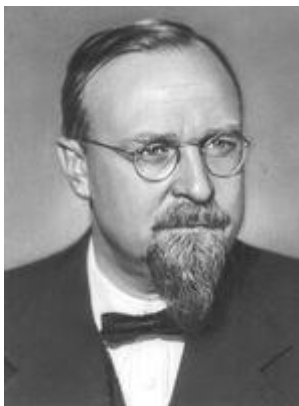
Alexander Ivanovich Oparin

Oparin mente at tidligere atmosfære var svært ulik dagens atmosfære. Energikilder som lynutladninger kunne påvirke karbonforbindelser i atmosfæren og omforme dem til mer komplekse forbindelser. I havet kunne slike komplekse forbindelser komme sammen og danne mikroskopiske klumper som var forløperne til den første cellen på jorda. Blant disse cellene var det celler som kunne utnytte fotosyntese. Oparins hypotese bygger på en rekke svakheter som vi ikke har plass til å diskutere i sin helhet.